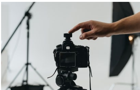
Ein perfektes Bewerbungsfoto erhalten Studierende beim Fotocorner