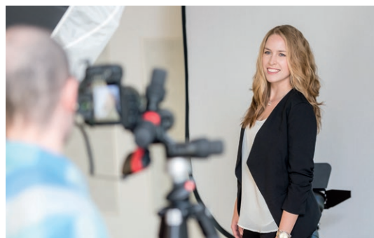
Ein perfektes Bewerbungsfoto erhalten Studierende beim Fotocorner